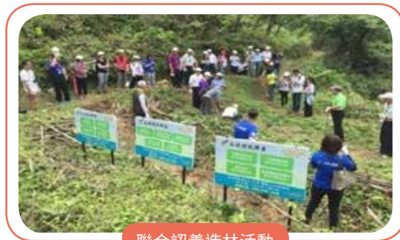
聯合認養造林活動

參與永續精銳聯盟之 106 年 ~108 年聯合認養造林活動，與其他 4 家企業共同認養 2.3 公頃：種植 3450 棵樹苗，吸收 5175KG 二氧化碳。