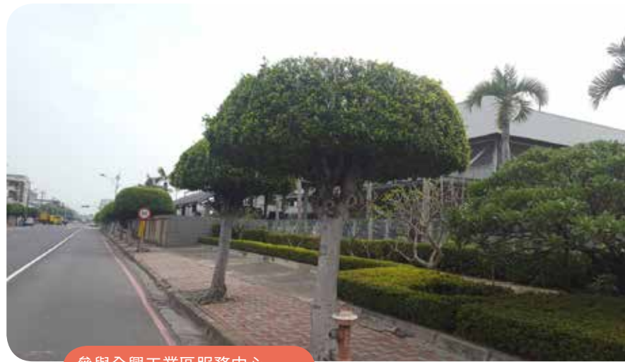
參與全興工業區服務中心 認養週界路樹定期修剪及養護