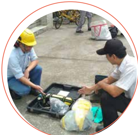
區域聯防毒災應變器材支援演練