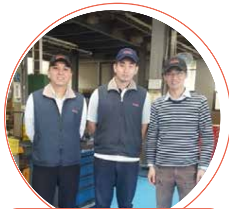
國立雲林科技大學教授訪視二廠學生

為實現本公司經營理念中之培育人才及回饋社會，自 92 年起與秀水高工建教合作迄今累計 120 人次，目前仍在職為 13 人，各大專院校產學合作實習在校 3 人，其中晉升股長 1 人，晉升工程師 2 人，未來秉持公司之經營理念推動產學合作、實習與參訪，充份運用學校及廠內資源，學生能學有所用，獲得教育及經濟滿足，讓學生能適應職場，鍛練一技之長，更是技術之傳承，培育未來之人才以回饋社會。