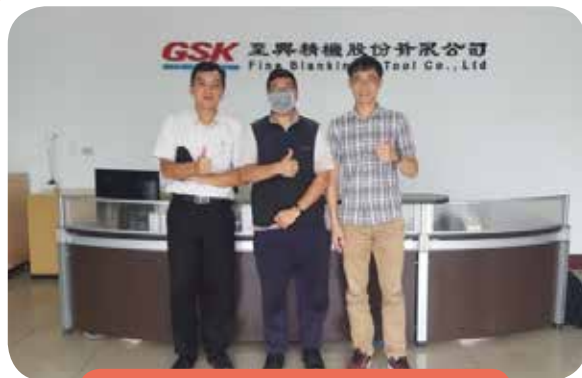
國立雲林科技大學教授訪視一廠學生

至興精機近年來積極網羅人才，從公司台灣地區總人數 377 人，越南地區總人數 591 人，大陸地區總人數 55 人，持續積極自地方選才並創造就業機會，廠內員工超過 90% 為附近鄉鎮之子弟，提供就業機會。隨本公司近年來業務及製程需求，將內部部份作業或零組件外包至附近鄉鎮的 100 多家企業，間接擴大創造就業機會。