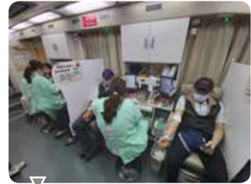
110 年舉辦快樂捐血人活動照片