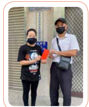
捐助溪底村社區發展協會