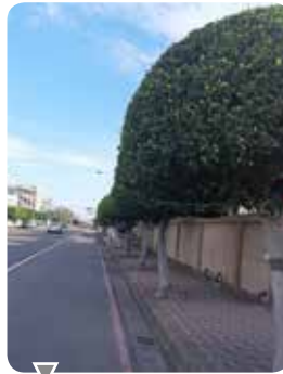
認養周界路樹定期修剪及養護

本公司 110 年捐贈高雄師範大學、彰化慈愛教養院、彰化家扶中心、台灣世界展望會、華山基金會伸港站、YMCA 慈善音樂會等，與全興工業區廠商協進會共同舉辦快樂捐血人活動，捐血人數計 45 人，250CC 血袋計 64 袋。未來將秉持著回饋社會的經營理念持續參與公益活動，回饋社會。