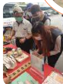
健康促進宣導及闖關