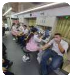
舉辦至興職安家族 快樂捐血人活動