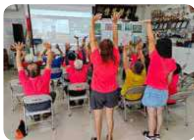
溪底村社區發展協會遠距健康促進課程