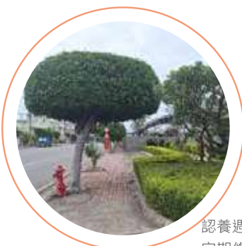
認養週界路樹 定期修剪及養護