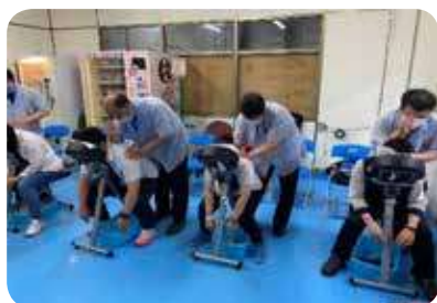
視障按摩紓壓放鬆